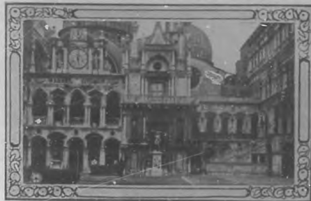
Patio interior del Palacio de los Dogas.

fiarse en las aguas.... Siguió resbalando la góndola entre los palacios