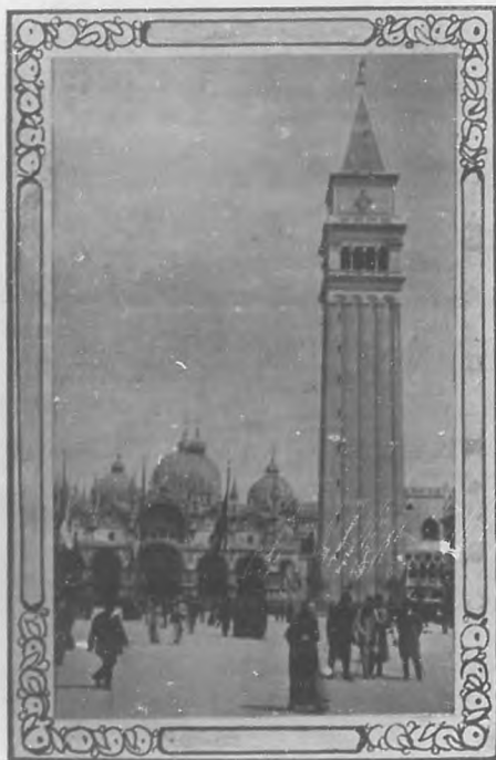
El Campanile y la basílica de San Marcos.

A la izquierda quedó la Dogana del Mare y la Iglesia della Salute con su ostentosa arquitectura. A la derecha los viejos palacios de la nobleza veneciana, vendidos por sus arruinados sucesores a los hoteleros modernos y los