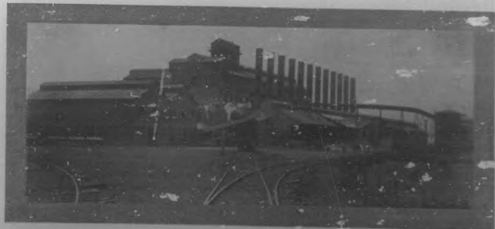
Fábrica Central "Stewart" en Ciego de Avila, que actualmente lleva montados 472.000 pesos de maquinaria y para sus 300 trabajadores se ha terminado la zafra de caña molido medio millón de sacos según aproximados cálculos.

Esta línea de "Bohemia" al querido amigo, como decimos, será de ca-