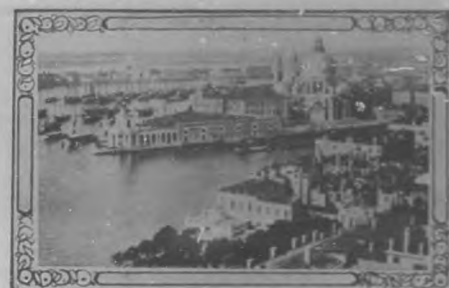
Una vista tomada desde el Campanile.