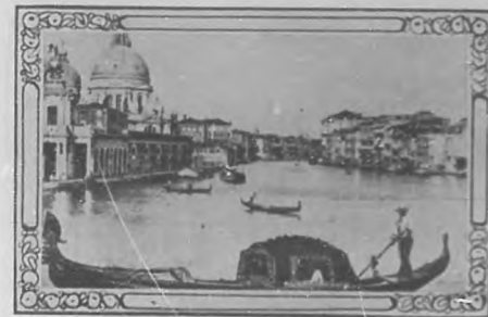
Entrada del Gran Canal.

Este Gran Canal que en forma de una enorme S atraviesa a Venecia, está todo él formado por las fachadas de los arcaicos palacios a cuyos mármoles de colores ha dado un tono dorado el correr de los años. Domina en ellos esa especial arquitectura veneciana en la que se unen las ojivas góticas, aquí completamente desprovistas de su austeridad septentrional, con los ricos caprichos de la fantasía oriental. Los mercaderes venecianos, en sus viajes